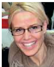
Miriam Kolko Glostrup Universitets Hospital, Øjenafdelingen og Institut for Neuro- videnskab og Farma- kologi, Københavns Universitet